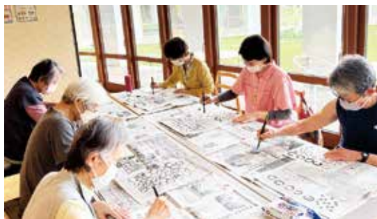
筆ペンを使ってお手本を見ながら挑戦した伝筆講座

5月と7月にフィットネス&スタジオパルとみぞくちテラソのインストラクターによる特別レッスンをゆうあいパルの旧レストスペースにて開催いたしました。今後の開催予定は広報ほうきの差し込みチラシにて、お知らせしますので、皆様のご参加をお待ちしております！